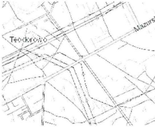
Szkic orientacyjny Skala: 1:25000